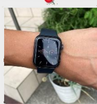
Apple watch 松田 選也

買うか・・・買わないか・・・ 買ってもし上手に使えるか・・・？って半年くらい悩んで買った「Apple Watch」案の定ぜんぜん使いこなせてない！笑 でもメッチャ便利なのは間違いない！ もっと勉強していきまーす！！