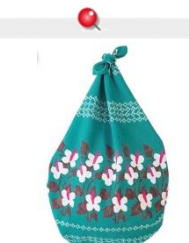
風呂敷 洞尻 起代

WORKMANで購入したキャンバスシューズです。 なんと、980円とコスパ最強です！！ 男女問わず、カジュアルやガーリーな服装にもマッチすると思います。